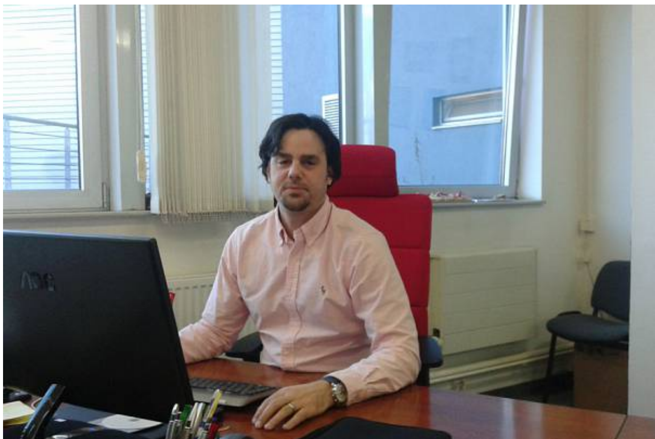
Autor: Asset Media

9 z 10 lidí, kteří si prošli nákupem a výběrem nemovitosti se shodují na tom, že nejhorší na celém procesu jsou prohlídky bytů či domů. Projekt Virtuální realitní kanceláře zbytečné prohlídky naprosto eliminuje.